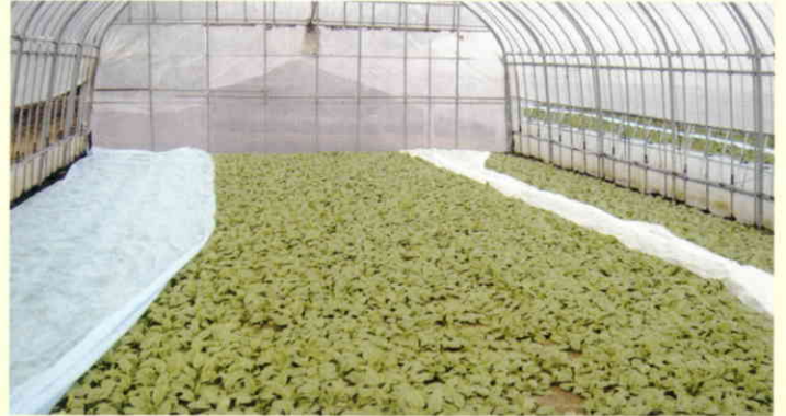
ほうれん草(岩手県)