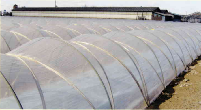
大根(茨城県つくば)