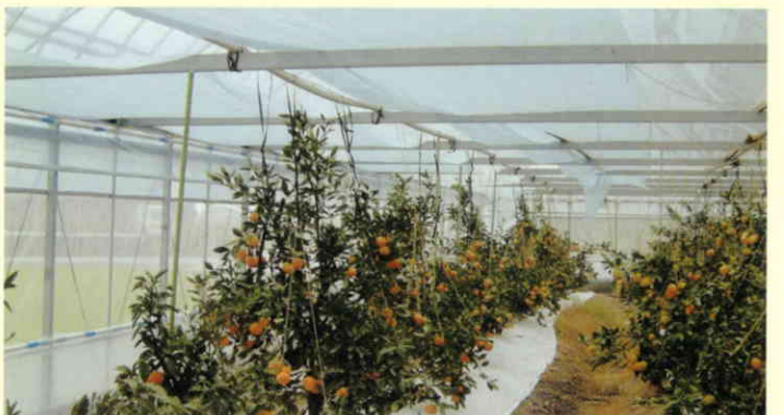
ハウスミカン(高知県)