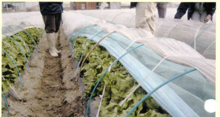
レタス(兵庫県淡路)