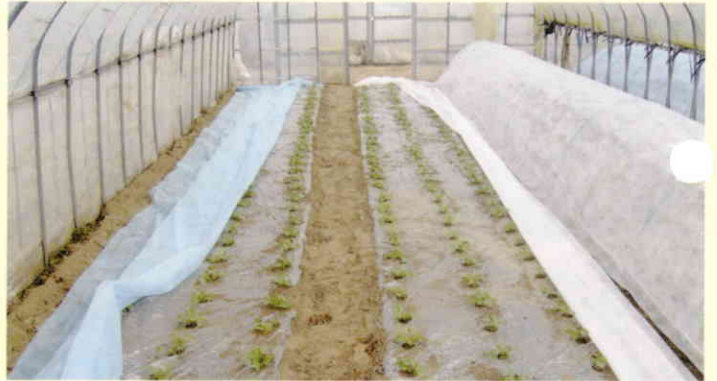
大根(千葉県横芝光町)