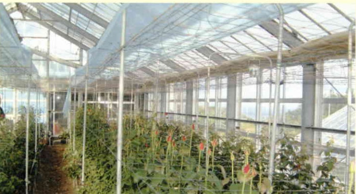
バラ(兵庫県淡路島)