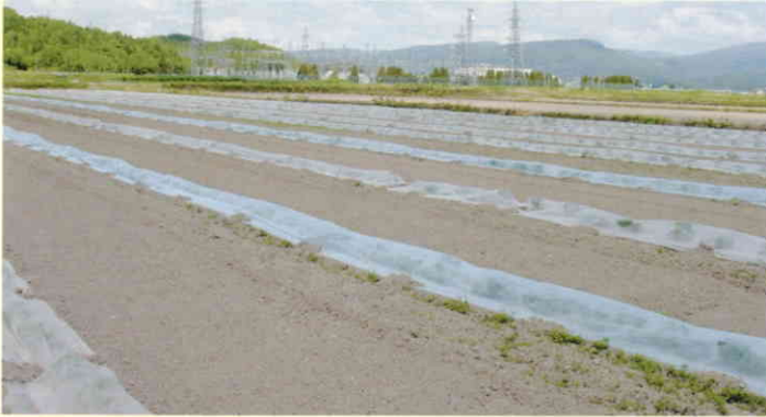
かぼちゃ(北海道名寄)